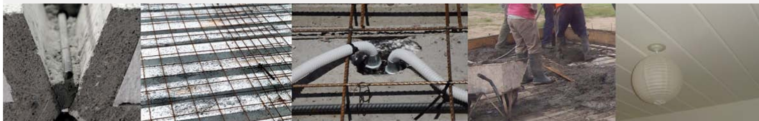
Llenar con hormigón el vértice del nervio y colocar hierro adicional